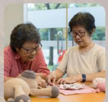
Hama Bead Craft